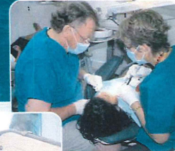
Dental care and eye surgeries done onboard the Sea Haven