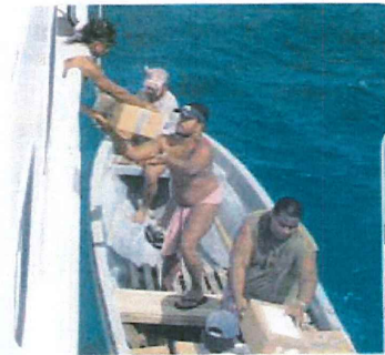
Delivery of school books

A welcome and important ministry to the island pastors and church leaders is the Biblical teaching the Sea Haven crew provides. Their goal is to develop Christian leaders and disciple men who can lead and grow established island churches.